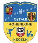
Bezirk Ostalb Hohenlohe Sektion Classic